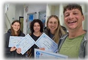
einige unserer motivierten Schwimmerinnen mit Schwimmtrainern*innen