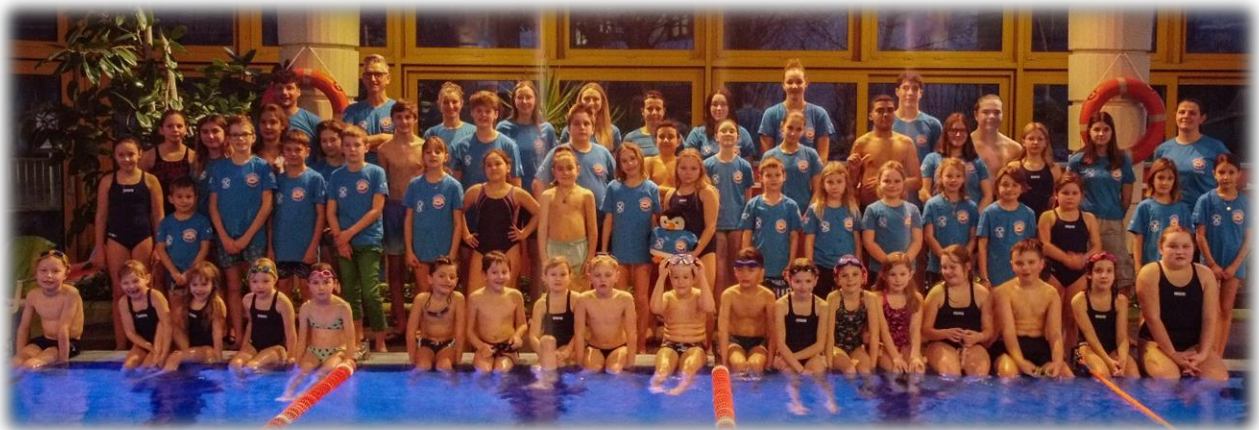
das Gruppenfoto der Schwimmer*innen in der Erlebnistherme Naturns

Im Jahr 2023 erfreuten sich die Anfängerkurse und Schwimmtrainings des SSV Naturns ASV/ASD nach wie vor großer Beliebtheit. Trainiert wurde in der Saison 2022/23 wiederum zweimal pro Woche im Therme- und Erlebnisbad Naturns und Aquaforum Latsch sowie einmal wöchentlich im Sportwell Mals .